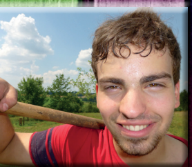
NATUR HAUTNAH ERLEBEN